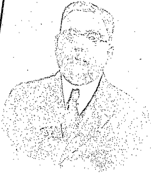
स्वर्गीय आचार्य रामचन्द्र शुक्ल